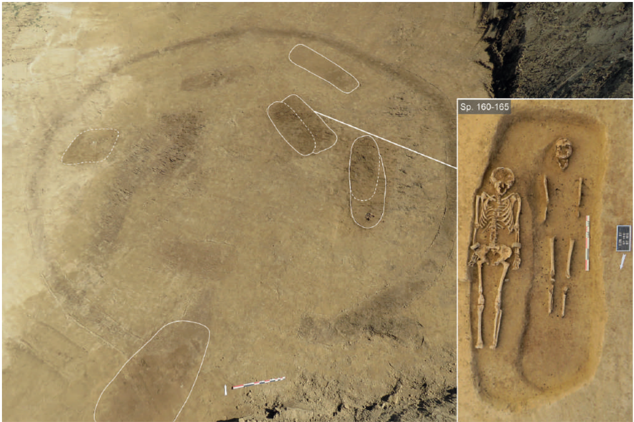
Fig. 2. Vue générale de l'enclos du site de Kolbsheim Knoblochsberg (site 2.1)

dimensions ajustées au corps, ont livré des individus bien conservés, mais dénués de mobilier. En revanche, les fosses appartenant au probable « cercle interne » présentaient pour la plupart des dimensions plus importantes et accueillait un aménagement en bois (coffrage ?) comme en témoignent quelques traces ligneuses. Les individus, dont le squelette était très mal conservé, étaient dotés d'éléments de parure relativement importants : plaques de ceintures, collier en perles de corail tubulaires, boucles d'oreille, agrafes, bracelets, fibules, torques, épingles en alliage cuivreux, divers éléments d'ambre (têtes d'épingle, pendeloque) ainsi que plusieurs exemplaires de bracelets en roche noire. Aucune tombe centrale n'a pu être mise en évidence probablement en raison de l'importante érosion subie par le monument. D'autres sépultures aujourd'hui entièrement détruites complétaient vraisemblablement cet ensemble.