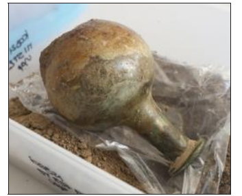
Les dernières fouilles ont révélé des objets exceptionnels.

Qui étaient ces Cambetois, dont les fouilles dévoilent les différenciations sociales ainsi que l'importante densité de la population ? Des Gal-