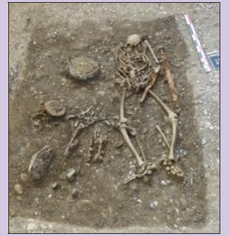
La tombe du guerrier mérovingien.

L'homme qui repose dans cette sépulture des alentours de 650 après Jésus-Christ est un guerrier mérovingien. Pas n'importe lequel, puisque l'étude de sa tombe a permis de détailler des objets prestigieux restés intacts : un chaudron en bronze, l' umbo (la partie centrale) d'un bouclier, un scramasaxe (un sabre) et une épée d'un mètre de long, entière, avec son fourreau. Enfin, un harnachement, celui du cheval qui a suivi son maître dans la tombe et a été inhumé juste à côté, sans sa tête, comme cela se pratiquait à l'époque. Le guerrier a été inhumé selon les rites païens. « Non seulement la découverte de vestiges mérovingiens est une première à Kembs, mais en plus, cette tombe nous est parvenue intacte, elle n'a pas été pillée. Pourquoi ? » s'interroge Axelle Murer.