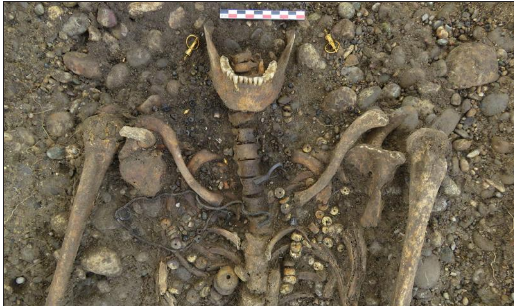
Gros plan de la sépulture d'une femme, richement dotée, avec boucles d'oreilles en or, chaînette en argent et collier en or, perles et os. Elle fait partie des 230 tombes découvertes dans la nécropole.

Cette nécropole du Bas-Empire, dont la datation reste à affiner, est considérée par les archéologues