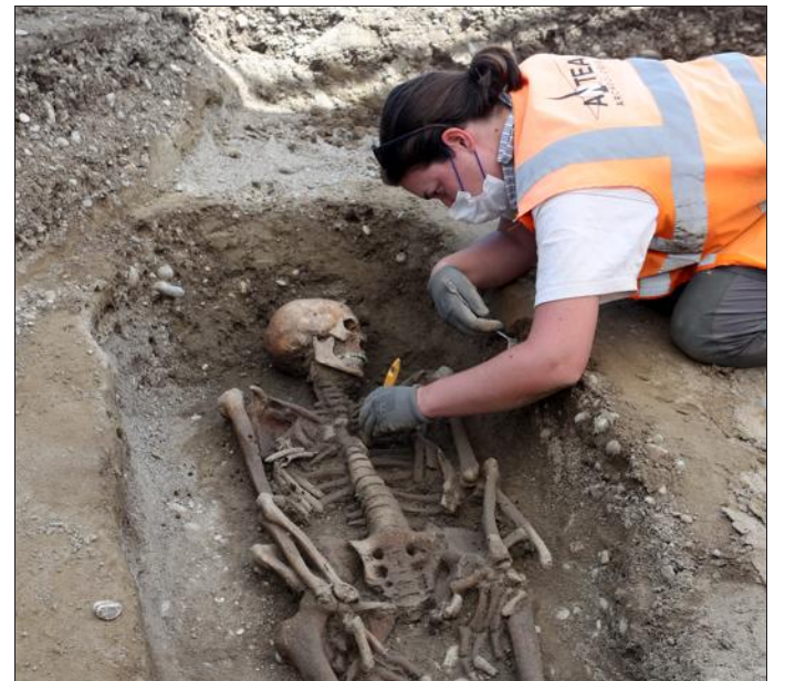
Les fouilles archéologiques à Kembs sont menées par l'opérateur habsheimois Antéa.

Découvrez plus de photos et une vidéo dans notre long format sur www.dna.fr