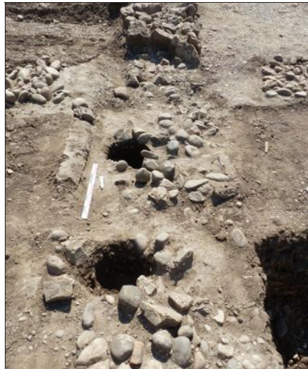
Gros plan sur les trous de poteaux de cet étrange bâtiment en abside, qui a été construit sur les fondations du praetorium , un bâtiment administratif.

Si cette hypothèse d'église paléochrétienne se vérifiait, cela éclairerait d'un jour nouveau la christianisation de l'Alsace à la fin de l'ère romaine. La religion chrétienne aurait pénétré plus facilement les grands centres urbains et aurait été plus lente à faire tache d'huile dans les campagnes. Mais Kembs-Cambete était une agglomération relativement importante en Haute-Alsace. Il ne reste donc plus qu'à prier pour que l'on trouve de quoi éclairer cette problématique, qui suscite pour l'instant la plus grande prudence.